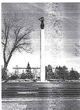
Рис.56. Стела «Богиня Победы Ника», установленная в парке Победы г. Семей