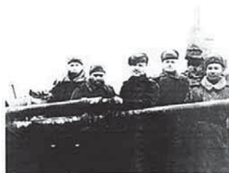
Рис.3. Группа бойцов 238-й (30-й Гвардейской) дивизии в районе г.Юхнов, 1942 г.

Враг стремился обойти 837-й и 830-й стрелковые полки, прижать их к реке Ока и захватить город Алексин, но