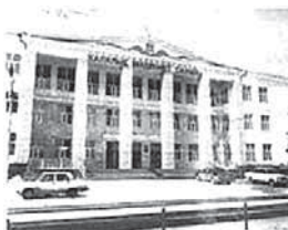
Рис.62. Семипалатинский городской Дворец Культуры

Однако авторы не считают законченными исследования по теме проекта. По нашему мнению, многое еще следует изучить, в том числе и связи между объектами памяти ВОВ и уровнем исторического сознания населения, особенно молодежи. К тому же требует выяснения, насколько память о ВОВ влияет на ограничение агрессии, распространения идей гуманизма и нацизма среди населения.