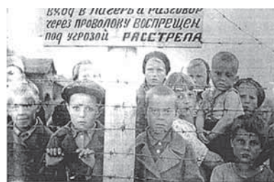
Рис.61. «Азарчешский лагерь смерти» [из фонда музея Боевой и Трудовой славы, ГДК г. Семей]