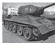
Рис.66-68. Из музея истории вооружения и военной техники Дома офицеров г. Семей: грузовой автомобиль ЗИС-5; 85 мм полевая пушка; танк Т-34