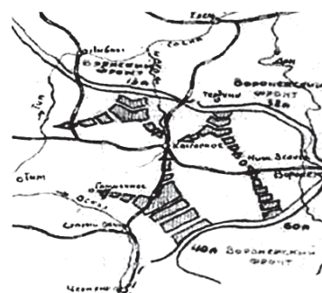
Рис.2. Схема боевых действий 8-ой стрелковой дивизии 26-30 января 1943 года [из фонда ЦДНИ ВКО, Р-705, оп.1, д. 99.]

на левом фланге 837-го стрелкового полка, пытаясь во что бы то ни стало выйти на дорогу Алексин – Железныя.