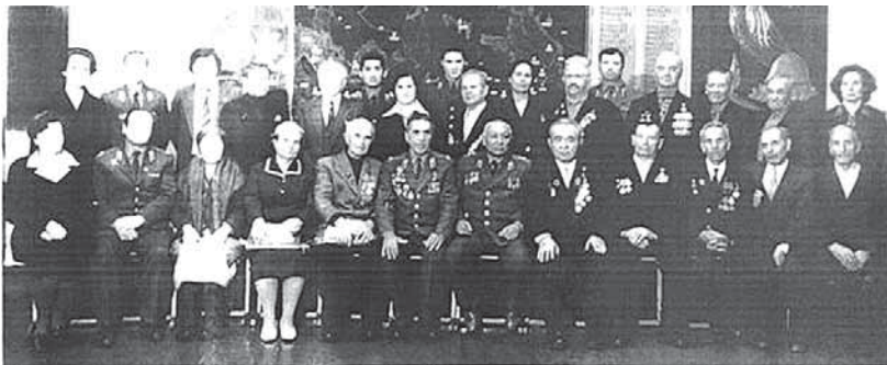
Рис.5. Встреча ветеранов 8-ой стрелковой дивизии, г. Семипалатинск, 1983 год, [из фонда музея Боевой и Трудовой славы ГДК г.Семей]