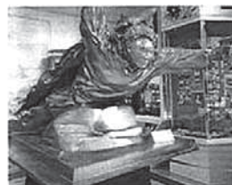
Рис.63-64. Музей Боевой и Трудовой Славы: памятник Героя СССР Жангазы Молдагалиева; пистолет Токарева Тульский (ТТ)