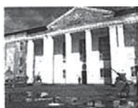
Рис.65. Дом офицеров г. Семей