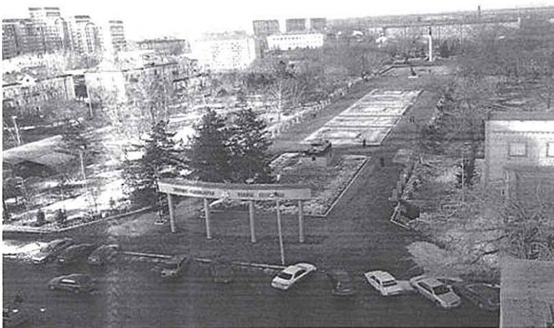
Рис.6. Общая панорама парка Победы г.Семей

бойцы 837-го стрелкового полка при поддержке двух рот 830-го стрелкового полка и саперного батальона, встретили атакующего противника сильным огнем. За время боев в районе города Алексин немцы только убитыми потеряли пять тысяч солдат и офицеров. На участке южнее города Алексин ежедневно противник терял 20-30 танков. В результате чего прекратил свое наступление [3].