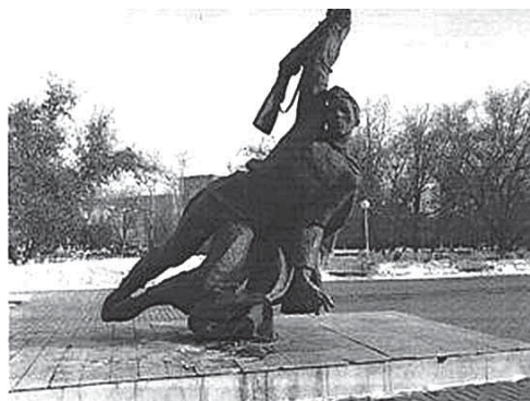
Рис.57. Памятник - монумент в честь семипалатинцев, павших в годы ВОВ, установленный в парке Победы г.Семей