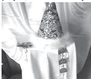
Рис. 16. _____