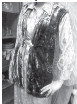
Рис. 18. _____