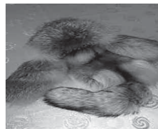
Рис. 17. _____