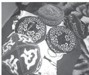
Рис. 15. _____