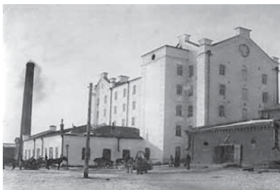
Рис. 2. _____