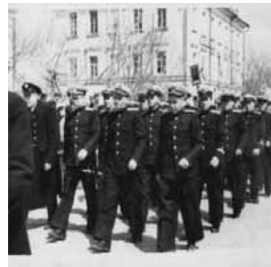
Рис. 10. _____