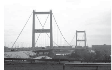
Рис. 7. _____