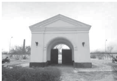
Рис. 1. _____