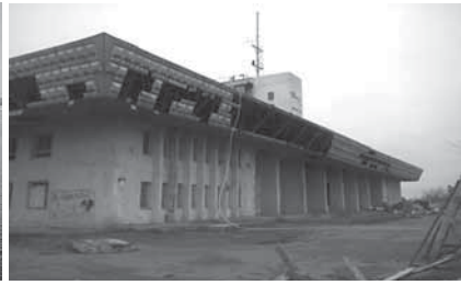
Рис. 4. _____