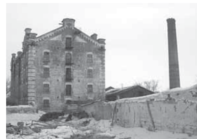
Рис. 3. _____