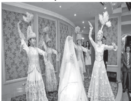
Рис. 19-20. _____