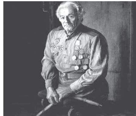
Рис. 13. _____